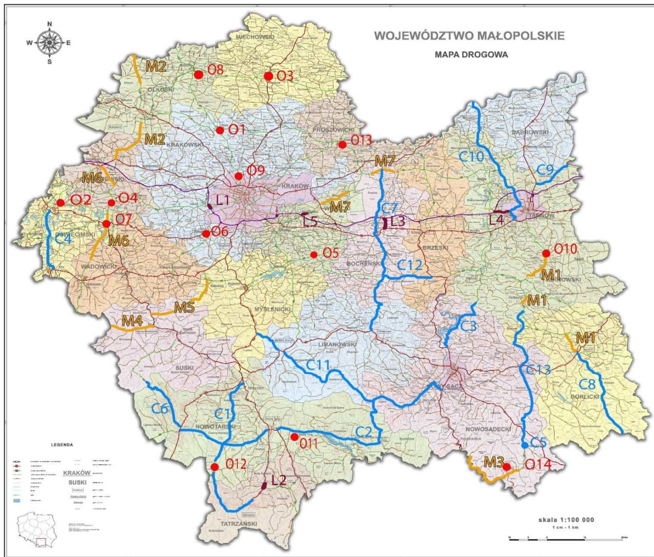
Rys. 2. Planowane inwestycje drogowe w Małopolsce do roku 2023